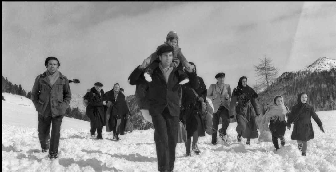
El camino de la esperanza. Pietro Germi

19:00 TRASFOCO: LA EMIGRACIÓN Nuevo Mundo, 113' Presentación del director / With the filmmaker: Emanuele Crialese El Almacén