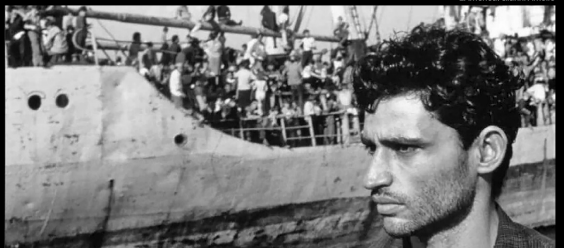
L'America. Gianni Amelio

El programa puede estar sujeto a cambios. Consulte la web.