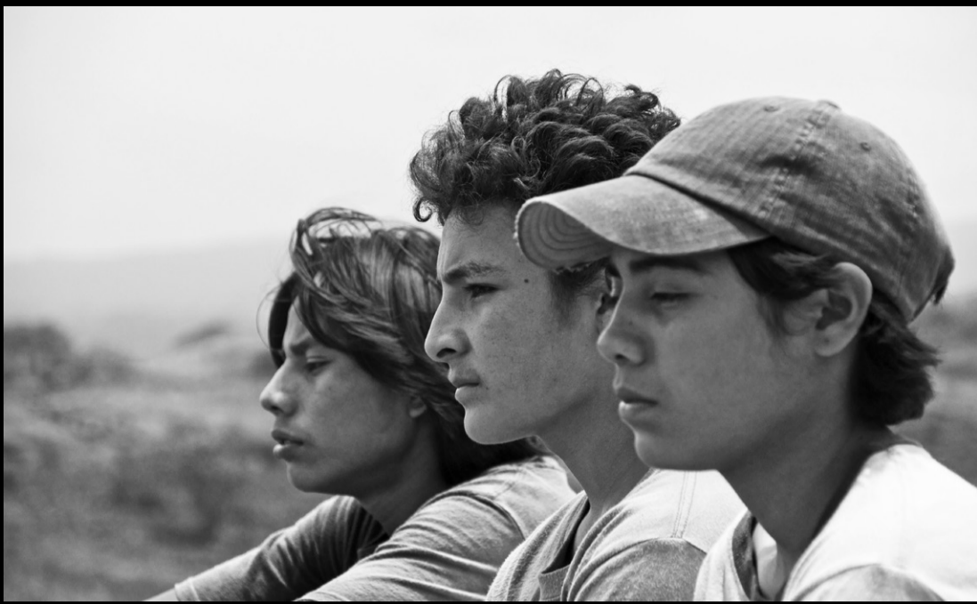
La jaula de oro. Diego Quemada-Díez