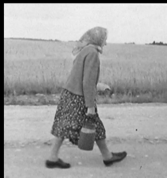
Reminiscencias de un viaje a Lituania. Jonas Mekas

20:00 TRASFOCO: LA EMIGRACIÓN Los Emigrantes, 151' El Almacén